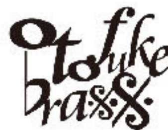
おとふけブラス Otofuke Brass [ブラスバンド]