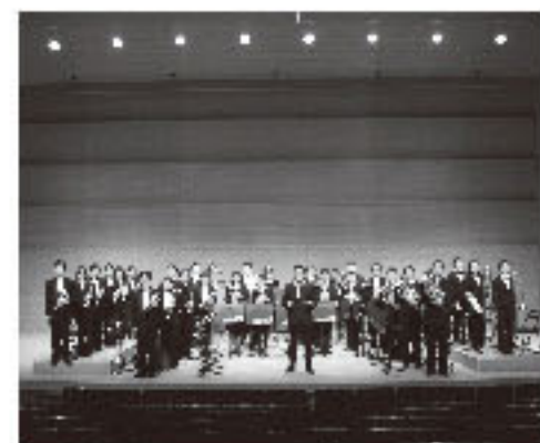
仙台ブリティッシュブラスバンド Sendai British Brass Band [ブラスバンド]